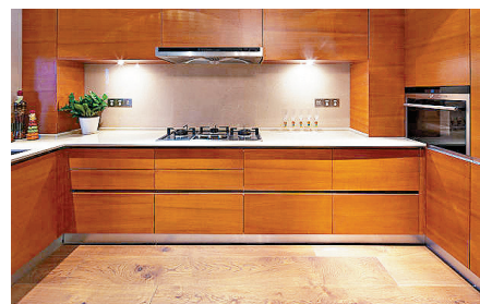
■西曆11月7日至翌年2月3日冬天出生的人，要通宵開廚房燈，增旺火運。

玄學上有哪些關於「燈火」的竅門可以做？我又爆些內幕給大家知道。第一個密碼，就是西曆11月7日至翌年2月3日冬天出生的人，由今天開始，要通宵開廚房燈，多用